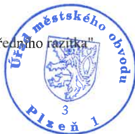
Renata Schimmerová Odbor stavebně správní Úřadu městského obvodu Plzeň 1

Tato písemnost musí být vyvěšena po dobu 15 dnů na úřední a elektronické desce příslušného Úřadu městského obvodu Plzeň.